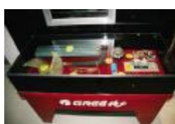
图为东北格力空调旗舰店内景、门头、零部件展示台

无论是从专卖店的硬件设施到装修布置,还是从专卖店人员的管理到服务质量的整体提升都有了系统的规范。