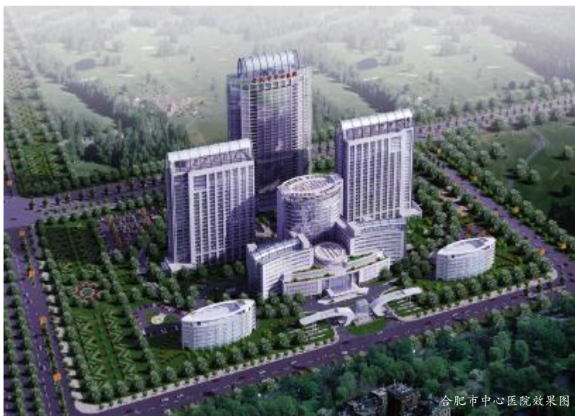
合肥市中心医院效果图

作为国内最早涉足中央空调领域的家电企业,格力早在1996年便自主研发出第一台模块式空调机组。2002年,格力凭借雄厚的技术实力,仅用两年的时间便成功研制出日本企业花了16年时间才研发出来的“GMV多联式中央空调”。格力